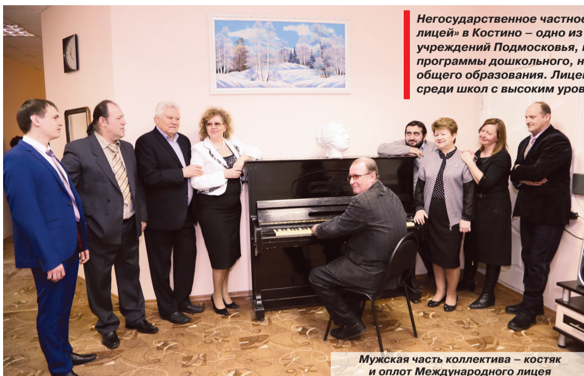
Мужская часть коллектива – костяк и оплот Международного лицея

Негосударственное частное учреждение «Международный лицей» в Костино – одно из престижных образовательных учреждений Подмосковья, где успешно реализуются программы дошкольного, начального, основного и среднего общего образования. Лицей прочно занял свою нишу среди школ с высоким уровнем преподавания